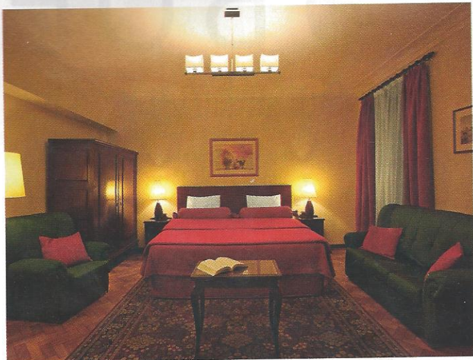
O Pão de Açúcar Bed & Breakfast

Policarpo, proprietário do Furadouro Boutique Hotel Beach & Spa e impulsionador da Policarpo Turismo, grupo que se dedica à elaboração de projetos hoteleiros em Portugal e Angola. Todo este cuidado permite ao estabelecimento, situado na zona costeira do concelho de Ovar, “ter consumos muito baixos e uma pegada ecológica reduzida”.